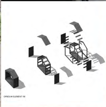
OPBOUW ELEMENT 1M

De Kas Amersfoort is multifunctioneel, geschikt voor bruiloften, vergaderingen, kookworkshops en exposities. Het is een flexibel stedenbouwkundig en maatschappelijk schakelpunt in een nieuwe woonwijk.